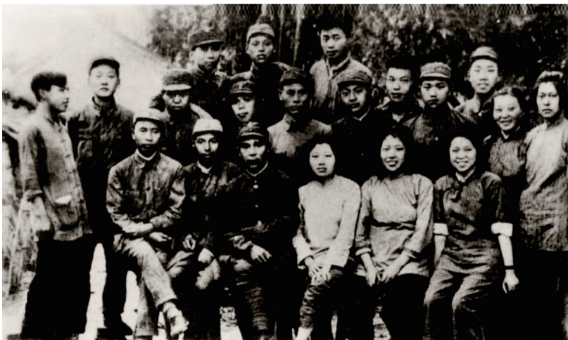
1941年,新四军6师教导大队指战员抵达高邮合影

1937年,全面抗战爆发。在中国共产党的领导和影响下,高邮地区广大民众、进步青年和各阶层爱国人士,纷纷投入抗日救亡运动。安徽郎溪人陈文组织一支民众抗日武装——抗日义勇团,在高邮湖西地区开展抗日游击战,多次奇袭日军,展现了不甘屈辱和不屈不挠的斗争精神。1939年10月2日上午7时许,日本华中派遣军两个大队绕过过关坝国民党军队的防线,乘汽艇由高邮湖石工头登陆,翻过城墙进入高邮城。驻防在高邮城的国民党省保安3旅和县常备旅经不住日军的攻击,弃城而逃。凶残的日军侵占高邮后,先后制造了高邮惨案、黄家庄惨案、寡妇圩惨案。不甘心做亡国奴的高邮人民,纷纷起来进行抗争,但因民众组织不严、武器落后,终顶不住装备精良的日伪军攻击。