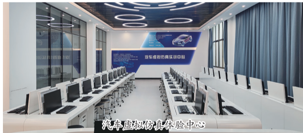
汽车虚拟仿真体验中心

学校占地284亩(含菱塘校区),建筑面积11万平方米。校园风格融高邮“邮文化”等地域特色和职业教育元素于一体,校门由对称的三片式“蛋壳”造型构造,以“超越广场”为中心,教学区、实训区、运动区、生活区围绕四周,布局合理;图书馆、报告厅、校长长廊等文化设施,环伺乐湖,美不胜收。