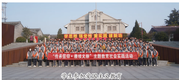
学生参加爱国主义教育

学校秉承“人本为先、乐业为天”办学理念 and “人品重于能力,做事始于做人”育人理念。逐步形成五轮驱动(中职、技工、高职、成人教育、社会培训)和两翼联动(技术服务、技术创新)发展架构。按照“适度规模、优化结构、服务当地”发展思路,营造“人人皆可成才、人人尽展其能”良好育人氛围。