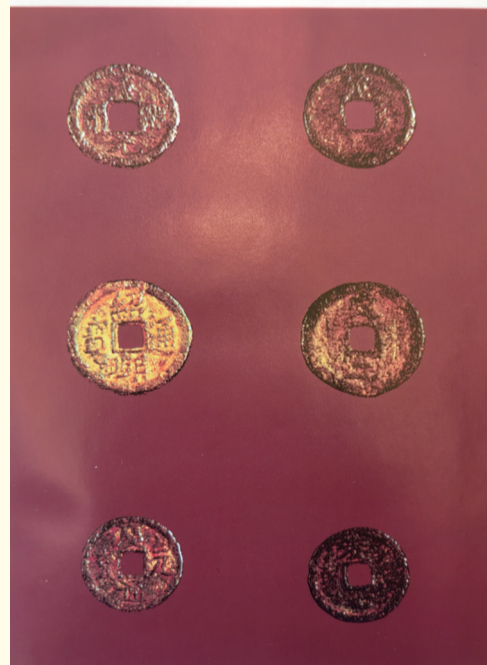
高邮出土铁钱珍品