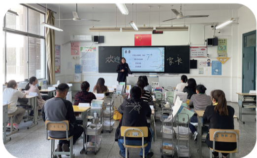
班主任向家长讲解班级整体情况

春风有信,花开有期。5月10日,2026年职业教育活动周暨高邮中专“家长一日访校活动”在和煦的春日里拉开帷幕。全校各班学生家长齐聚校园,共赴一场温暖的育人之约,携手探讨学生成长教育之路。