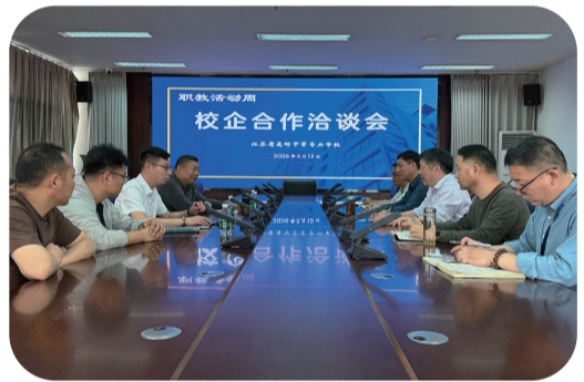
校企合作携手育英才

深化产教融合,携手共育英才。5月15日,高邮中专隆重举行职业教育活动周暨校企合作座谈会与签约仪式,旨在搭建校企对话平台,推动产教融合、协同育人。仪式上,星浪光学、华富储能、北联信息、欧力特、天业科技、传艺科技、航天锂电等多家本土企业代表出席。校企双方签订合作框架协议,为企业产业导师颁发聘书。企业代表就人才培养、实习安排和技术交流等提出了有针对性意见和建议。