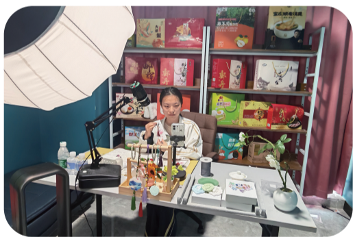
学生参与直播实践

校企携手助发展,直播赋能兴家乡。高邮中专长期深耕文旅电商与新媒体直播领域,多年来,始终紧扣“文旅+电商+直播”融合路径,持续推动“赛、教、练、创”一体化育人。今年职教活动周期间,该校组织商贸服务系师生走进高邮通邮电商产业园,开展电商直播实践活动。在企业导师与专业教师的共同指导下,学生们走进标准化车间,开展高邮土特产直播实战演练。