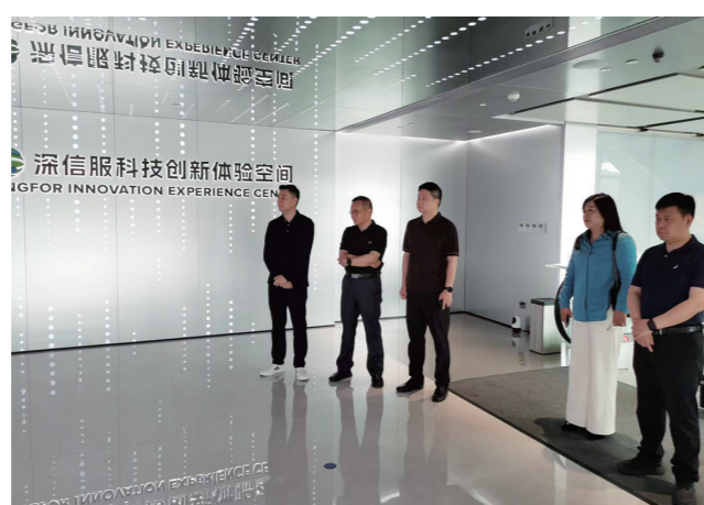
赴深圳开展招商拜访活动