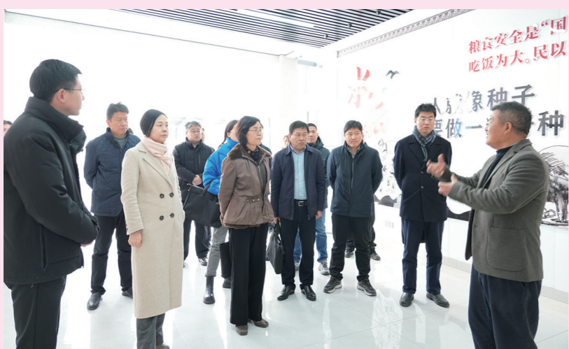
市领导带队调研周山镇种业发展

春潮涌动千帆竞,项目攻坚正当时。今年以来,周山镇党委、政府紧扣“春季招商敲门行动”部署,坚决扛起发展责任,以“开局即决战、起步即冲刺”的奋进姿态和务实举措抓好招商、推进项目、服务企业,全力为全市经济社会发展注入周山动能。