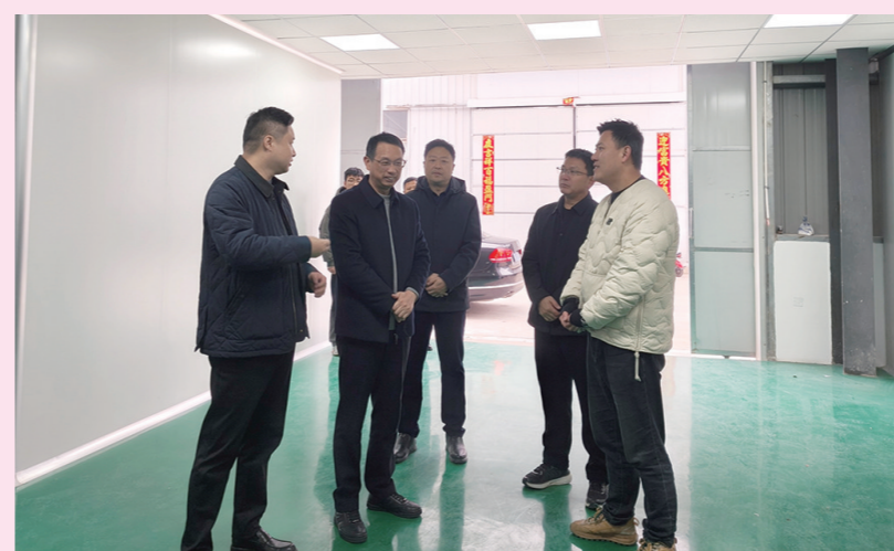
市领导赴周山镇走访企业