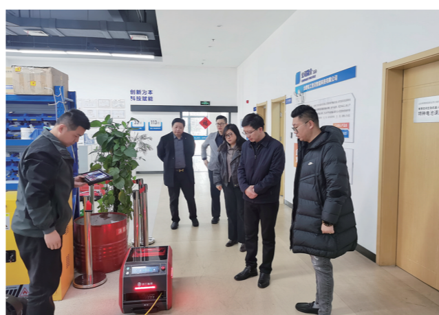
赴合肥开展招商拜访活动