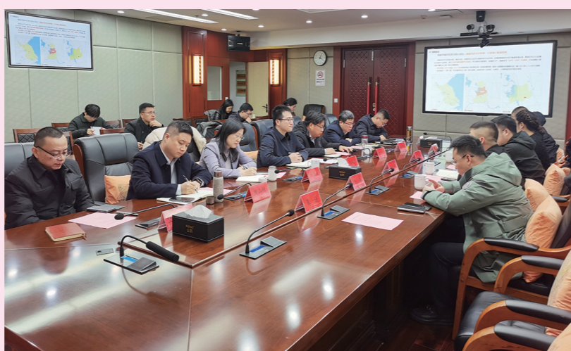
市领导参加接待周山镇推介飞地项目(京东物流智能园区项目)