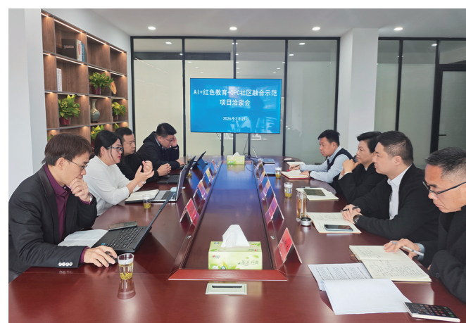
深圳市优必选科技股份有限公司来镇考察

征程万里风正劲,重任千钧再出发。下一步,周山镇将继续保持“拼、抢、实”的工作状态,聚焦招商目标不松懈、紧盯项目推进不停步,持续深化精准招商、链式招商、以商招商,全力推动在谈项目快签约、签约项目快开工、开工项目快投产、投产项目快达效。同时,不断优化营商环境,提升服务质效,以更大决心、更实举措、更优作风,全力以赴招大引强、聚链成群,奋力谱写招商引资与项目建设新篇章。