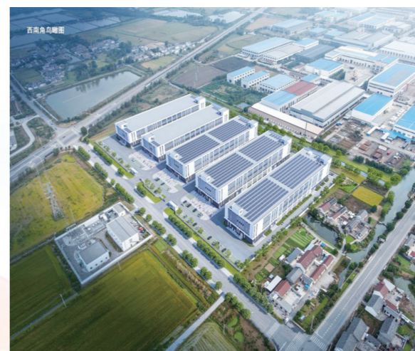
总投资2亿元邮源绿色产业园标准化厂房项目