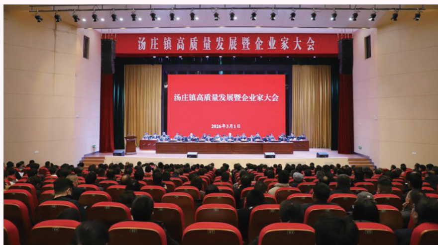
汤庄镇召开高质量发展暨企业家大会

今年以来,汤庄镇紧扣全市“511”产业体系建设部署,锚定“东北部乡镇领先、全市争先、扬州进位”目标定位,以“开年即冲刺”的姿态,在招商引资、项目建设、经济发展等全面加压奋进,“十五五”开局“第一棒”,跑出了加速度。