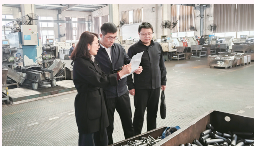
镇领导走访调研弘鼎公司