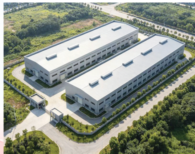
总投资2亿元升源高压电器限流限压配件项目

实现新签约亿元项目10个,其中专业装备产业链项目8个,分别为总投资3亿元智都智能加工装备项目、总投资2亿元升源高压电器限流限压配件项目、总投资2亿元伟能防震智能机柜项目、总投资1亿元迅贤精密机械零部件项目、总投资1亿元平顺3D打印机丝杆项目、总投资1亿元正诚铝合金加工项目、总投资1亿元振世达汽车零部件制造项目、总投资1亿元海通物流包装材料项目;现代服务业项目2个,分别为总投资2亿元邮源绿色产业园标准化厂房项目、总投资1亿元海扬数字贸易物流平台项目。一季度已完成列市项目开工7个,分别为至锐重大技术装备项目、奥斯启液压机械项目、宏威脱硝阀门项目、汇力机械配件项目、恒瑞达液压机械配件项目、邮源绿色产业园项目、海扬数字贸易物流平台项目。已完成扬州“三新”项目开工4个,分别为伟能核电防震智能机柜制造项目、里下河康养小镇项目、绿色产业园标准化厂房项目、海扬数字贸易物流平台项目;竣工3个,分别为欣欣锂电池新材料项目、凯能铜杆阳极板项目、欣欣高性能电子线路铜箔制造项目。