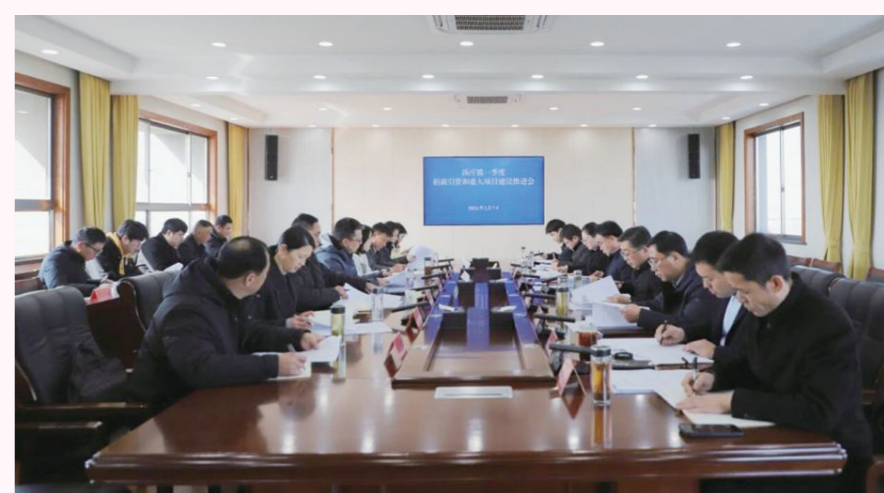
汤庄镇召开一季度招商引资、重大项目建设现场推进会

一是“链”上发力,攻坚招商引资。 根据市春季招商“敲门行动”整体部署,汤庄镇紧扣专业装备产业链,打好以商引商、英才招商“组合拳”,积极参与沿沪宁产业创新带建设,对接上海专业产业园。紧盯国央企、科研院所等重点资源,严格落实“七看七问”招商工作法、“9123”项目准入和“5080”标准,精准对接智能制造、新能源装备等关键赛道项目。今年已外出开展招商活动20批次,接待客商来邮洽谈25批次,新签约亿元以上项目9个,投资总量达14亿元。