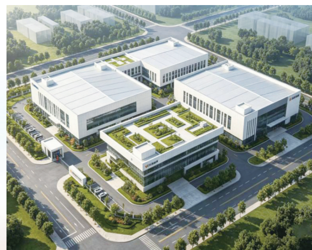
总投资3亿元智都智能加工装备项目