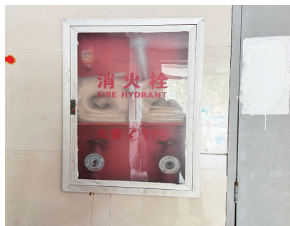
怡嘉天下B区25幢3单元破裂的消防栓玻璃橱窗现已更换

自“文明城市大家谈”系列宣传活动聚焦我市消防设施安全隐患问题以来,相关部门、属地、社区、物业等迅速响应、积极行动,全力推进消防设施排查整治与维护管理工作。近日,记者走访发现,整治已初见成效,部分居民小区的消防器材配置逐步完善,占用消防通道的杂物已被清理,通道恢复畅通,居民生活安全更有保障。