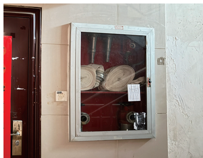
怡嘉天下B区88幢1单元水带缺失问题已整改