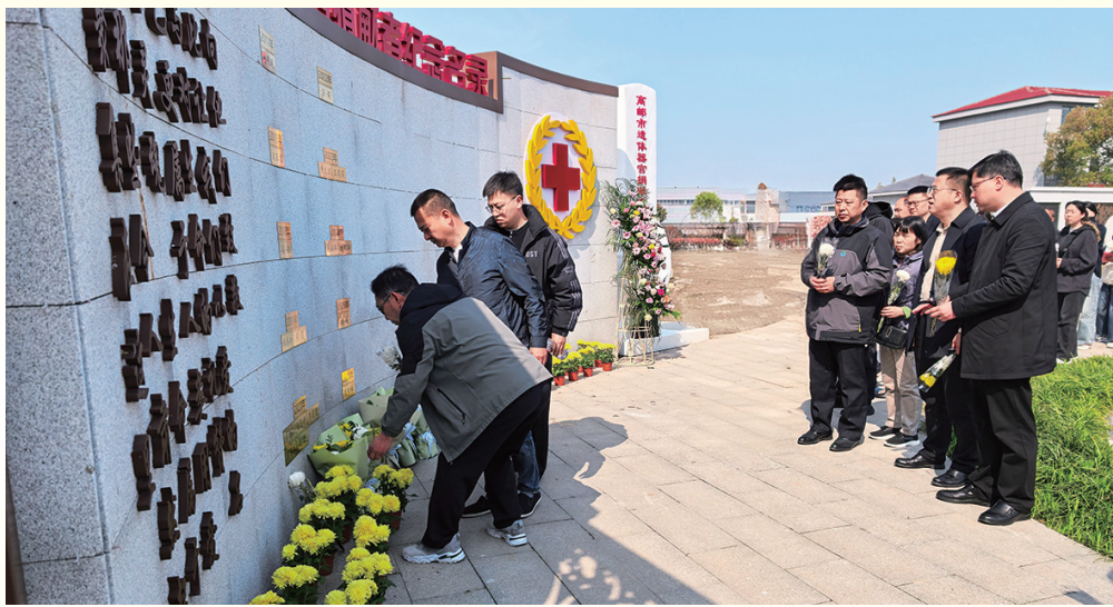
2日上午,我市在开发区墓园举行2026年“我们的节日·清明”新时代文明实践暨遗体器官捐献缅怀纪念活动,同步举行遗体器官捐献纪念馆落成仪式。活动现场,参与者签名倡议文明祭扫,观看捐献宣传短片,聆听家属感人发言。全体人员向红十字遗体器官捐献者纪念碑敬献鲜花、肃立默哀,并前往生态环保葬区寄思,以绿色方式致敬生命馈赠、弘扬大爱精神。