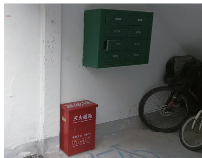
烟雨园二区11幢1单元遮挡灭火器箱的僵尸车已被清除