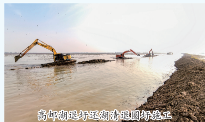
高邮湖退圩还湖清退围圩施工