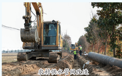
农村供水管网改造

站在新的起点,市水利系统将秉持初心使命,聚焦“十五五”发展蓝图,以更加饱满的热情、更加务实的作风,奋力谱写高邮水利现代化新篇章,为全市经济社会高质量发展作出新的更大贡献!