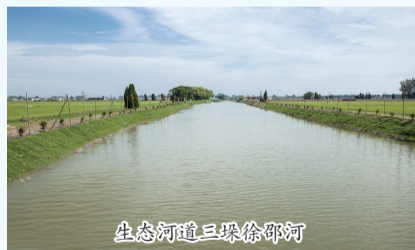
生态河道三垛徐邵河