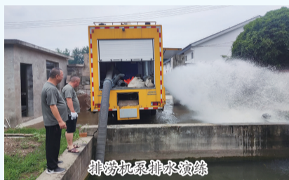
排涝机泵排水演练