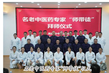
名老中医药专家“师带徒”拜师仪式