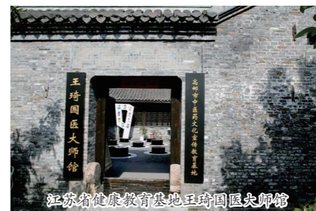
江苏省健康教育基地王琦国医大师馆

急诊科、肺病科、中医护理和泌尿外科。有全国基层名老中医药专家传承工作室1个、扬州市中医学名师工作室4个。 传承发展中医药特色优势的同时医院高度重视现代医学的发展,不断加强临床新技术新项目的开展应用,积极开展冠心病介入治疗技术、起搏器介入诊疗技术、神经血管介入诊疗技术、肿瘤消融治疗技术、放射性粒子植入治疗技术、腔镜微创手术、关节置换术等现代诊疗技术。 医院始终坚持“融汇中西,强化特色,惠泽百姓”的办院宗旨,高度重视“名医、名科、名院”三名战略的实施,紧紧围绕“解放思想、顺应医改、聚力创新、改善服务”十六字发展方针,充分发挥中医药特色优势,认真对待每一位患者,久久为功,砥砺前行,守正创新,踔厉奋发,致力打造患者满意、员工满意、政府满意“三满意”的本地最好的人文医院。 高邮市中医医院将以三级甲等中医医院的更高要求和全新面貌,为中医药事业发展和中国式现代化健康高邮建设贡献坚实的中医力量。