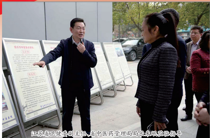
江苏省卫健委副主任、省中医药管理局局长来院视察指导