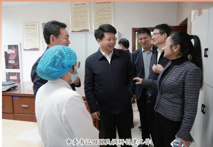
市委书记田晓红调研创建工作