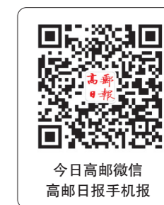
今日高邮微信 高邮日报手机报