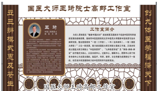
国医大师王琦高邮工作室