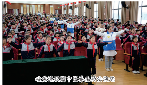
岐黄进校园中医养生功法表演