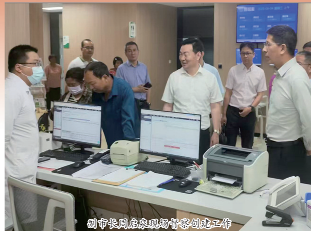
副市长周启康现场督察创建工作