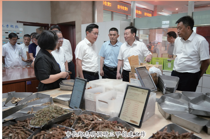
市长朱惠明调研三甲创建工作