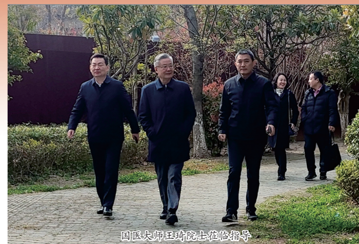
国医大师王琦院士莅临指导