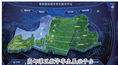
高邮灌区数字孪生展示平台