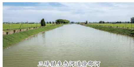
三垛镇生态河道徐邵河

保督察反馈问题整改等为抓手,清理整治了一大批涉水违章问题。高邮湖退圩还湖工程通过环保销号验收,清退圈圩土方254.22万立方米,恢复湖区面积超35平方公里。建成农村生态河道1092.1公里、幸福河湖135条、生态清洁型小流域10个。