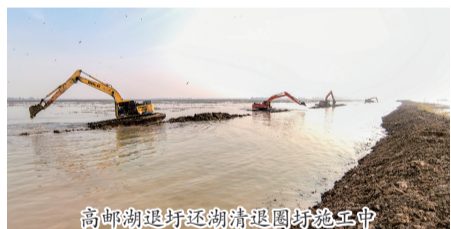
高邮湖退圩还湖清退圈圩施工中