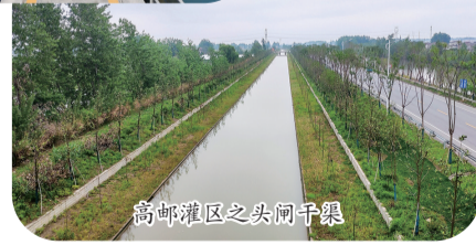
高邮灌区之头闸干渠

2026年是“十五五”开局之年,水利部门将紧紧围绕市委、市政府中心工作,聚焦全面提升持久水安全、优质水资源、健康水生态、宜居水环境、先进水文化和绿色水经济,努力建设水利现代化高邮样板,在锻造未来扬州“顶梁柱”、推进“强富美高”新高邮现代化建设的大局中展现更多水利担当。