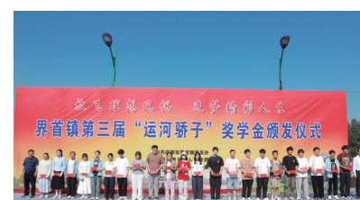
第三届“运河骄子”奖学金颁发仪式