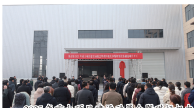
2025年重大项目启动仪式暨我里机电多线切割设备制造项目开工仪式

精准绘制主导产业链招商图谱,扎实推进“强链补链延链”,全年招引亿元以上项目10个,重大项目开工、竣工、达产多点突破,实体经济支撑力持续增强。坚持科技创新和产业升级双轮驱动,新增科技型中小企业4家、中小型科技企业备案12家,招引高新技术3家,申报省级先进级智能工厂2家,科创赋能产业升级的活力持续迸发。