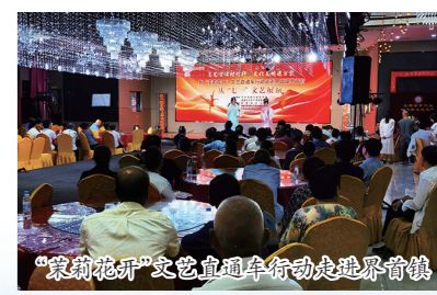
“绽放花开”文艺志愿服务行动走进界首镇