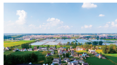
宜居宜业和美乡村——衣马村

深入推进农村人居环境“四河六路”先导区建设,高质量建成宜居宜业和美乡村示范项目,乡村生态韵味与人文底蕴持续彰显;盘活乡村闲置资源,规范集体“三资”管理,培育家庭农场拓展多元业态,多渠道拓宽农民增收致富路径。持续夯实农业发展基础,建成绿色优质食味稻基地2.3万亩,粮食总产量稳定超3.6万吨,“米袋子”“菜篮子”保障有力。