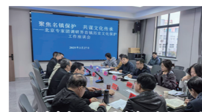
北京专家团队调研界首镇历史文化保护工作座谈会

立足道口区位优势,以高水平建设大运河文化带为牵引,深耕“东方白鹤保护区”建设,厚植生态文明底色。强化文化遗产系统性保护,擦亮“国家历史文化名镇”名片。高标准完成京杭运河界首水上服务区建设,稳步推进通达路、创业路等交通干线及乡村振兴桥梁提档升级,以基础设施硬支撑激活枢纽辐射动能,推动城镇功能与发展活力双向提升。