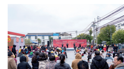
“争先锋·文明在行动”高邮市2025年新时代文明实践“春风暖心”便民服务中心

坚守民生为本理念,举办第三届“运河骄子”奖学金颁发仪式,开展第二批“小镇大爱·点亮希望”特殊困难家庭全程关爱行动。持续优化公共服务供给,不断改善中小学办学条件,着力提升基层卫生健康服务能力。全面深化社会治理,以全域网格化联动安全生产、食品安全链条监管,筑牢坚实稳定防线。