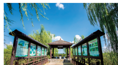
东方白鹤湿地公园观鸟亭