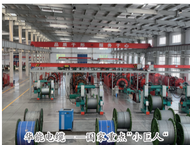
华能电缆——国家重点“小巨人”