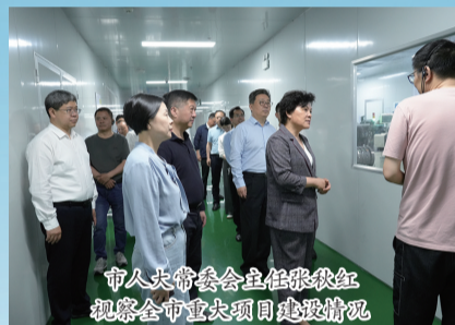
市人大常委会主任张秋红 视察市重大项目建设情况