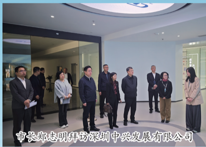
市长郑志明拜访深圳中兴发展有限公司