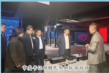
市委书记田醒民参加招商

2025年,市工信局在市委、市政府坚强领导下,对标对表“冲刺决胜年”总体要求,锚定工业经济高质量发展目标,聚焦“强产业、优服务、促转型”,以实招硬招推动各项工作提质增效,为全市经济社会发展注入强劲动能。