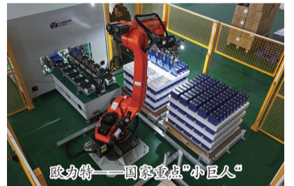
欧力特——国家重点“小巨人”