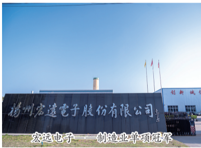
宏远电子——制造业单项冠军