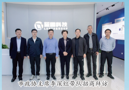
市政协主席李深红带队招商拜访