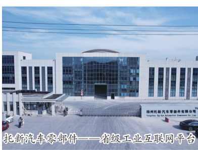
托新汽车零部件——省级工业互联网平台