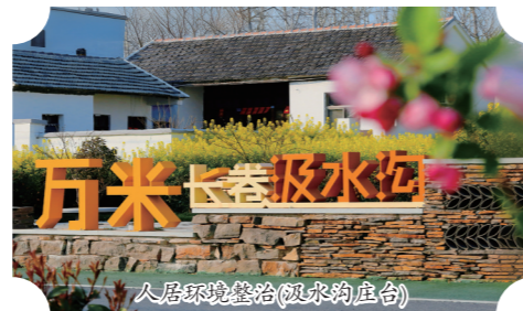
人居环境整治(双桥的庄台)