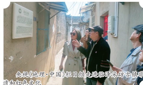
央视《地理·中国》栏目组走进临泽采访古镇非遗和红色文化