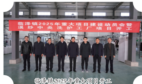
临泽镇2025年重大项目开工

1、聚力产业跃升,构筑现代化体系新高地。以打造食品工业化、制造智能化、产业高端化为中长期目标,紧扣智能终端、专业装备、新型食品、复合材料等“511”产业体系相关方向,开展精准招商,加快形成高新产业集聚;持续扩大产学研协作成果,加快工业、农业前沿技术转化;着力推动食品产业园重大战略规划落地,全力打造农产品精深加工项目集聚态势。 2、聚力城乡融合,绘就全域共同富裕新画卷。发挥立华智慧牧场、明林水产、禾谷牧业等农业重点企业和营南村食用菌、果林社区数字果园等重点项目带动作用,持续丰富村集体经济产业,培育高素质农民队伍;实现农村公路提档升级和危桥改造全覆盖,加强水利基础设施建设;提升集镇公共服务承载能力,分步推进镇南基础设施建设,改造集镇区老旧街巷。 3、聚力民生改善,打造幸福美好生活新典范。巩固教育格局调整成果,优化师资力量,保持全市农村教育领先水平;健全覆盖全民、统筹城乡、公平统一、可持续的多层次社会保障体系,推动各类保险精准扩面,不断提升普惠性、兜底性社会保障水平;补齐养老服务短板,整合养老服务设施,不折不扣落实好各项惠民政策,不断提高群众幸福指数。 4、聚力安全发展,构筑和谐稳定新根基。守牢生态保护红线,强化国土空间用途管制,推进低效建设用地减量清零,持续提升里下河地区生态系统稳定性,优化自然资源可持续服务能力;压紧压实安全生产责任,建立专业安全应急队伍;排查化解基层矛盾风险,常态化开展“平安临泽”建设,坚决守护全镇群众生命和财产安全。