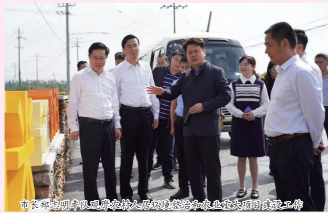
市长郑建明率队观摩农村人居环境整治和农业重大项目建设工作