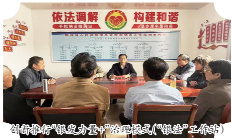
创新推行“银发力量”治理模式(“银法”工作站)