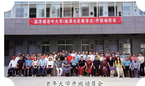
老年大学开班动员会