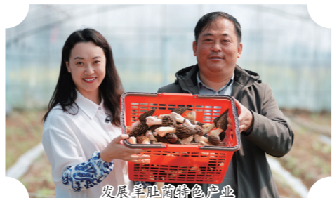
发展阜丰的特色产业