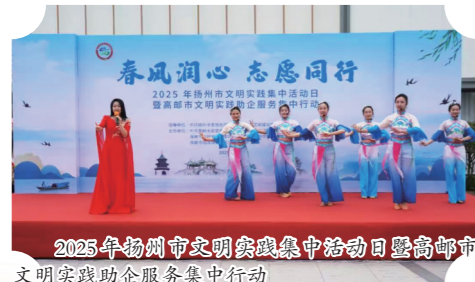
2025年扬州市文明实践集中活动日暨高邮市文明实践助企服务集中行动