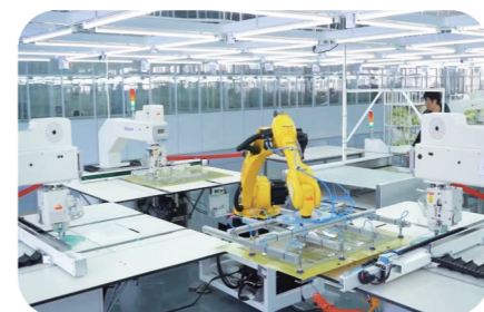
佰蒂服饰入选国家先进级智能工厂