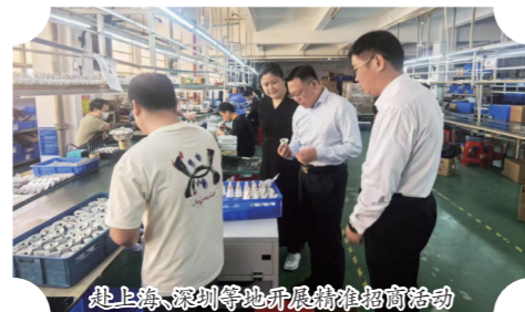
赴上海、深圳等地开展招商活动