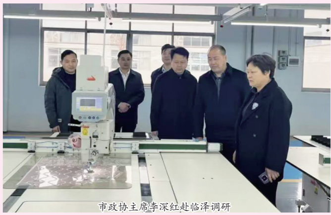
市政协主席李深红赴临泽调研