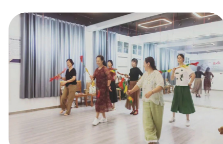
乐享“银龄”学在夕阳