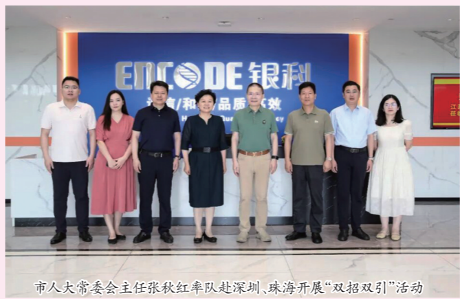
市人大常委会主任张秋红率队赴深圳、珠海开展“双招双引”活动