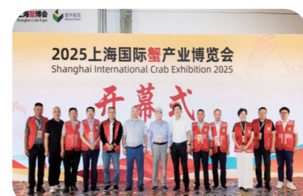
临泽川东大闸蟹亮相上海国际蟹产业博览会