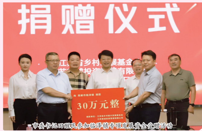
市农委书记田国民参加临泽镇专项发展资金捐赠活动