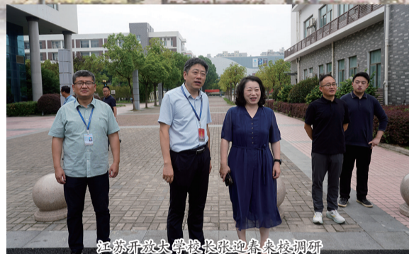
江苏开放大学校长张迎春来校调研