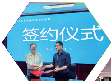
▲与企业签署《校企合作框架协议》