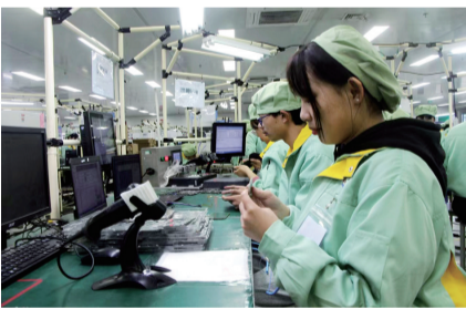
学生进企业进行实操练习