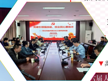
▼高邮中专礼仪服务两会