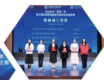
▲托幼专业国赛摘奖