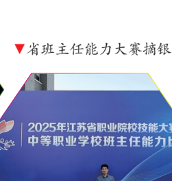
▼省班主任能力大赛摘银