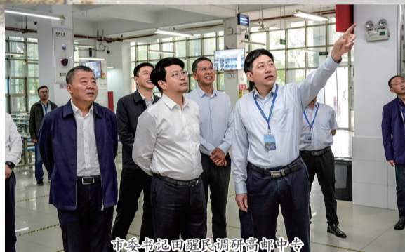
市委书记田超民调研高邮中专

岁序更新,春风可期。高邮中专在市委、市政府和上级主管部门的坚强领导下,在各级领导的亲切关怀下,全体师生走过了同心同向、锐意进取、成效卓著的2025年。在高质量发展的职业教育赛道上,全体师生以奋进之姿、务实之态,根植地方沃土,聚焦立德树人根本任务,培育高素质技术技能人才,交出了一份充满温度与厚度的答卷。