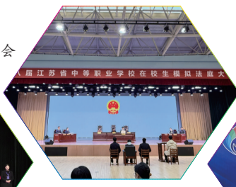
▲第八届江苏省中等职业学校在校生模拟法庭大赛现场