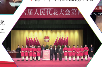
▼第八届人民代表大会