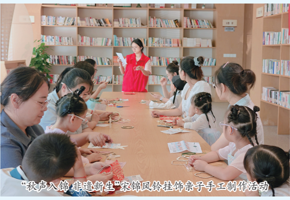
“秋声入韵 非遗新生”宋锦凤鞋挂饰亲子手工制作活动