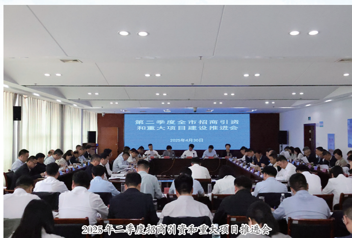
2025年三季度招商引资和重大项目推进会