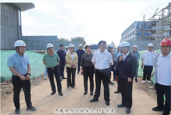
开展重点区域安全生产督查