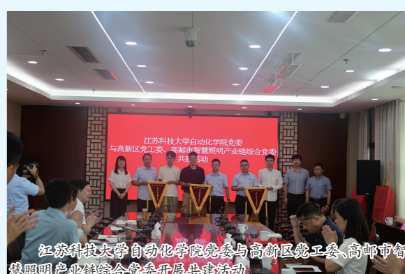
江苏科技大学自动化学院党委与高新区党工委、高邮市智慧照明产业综合党委开展共建活动