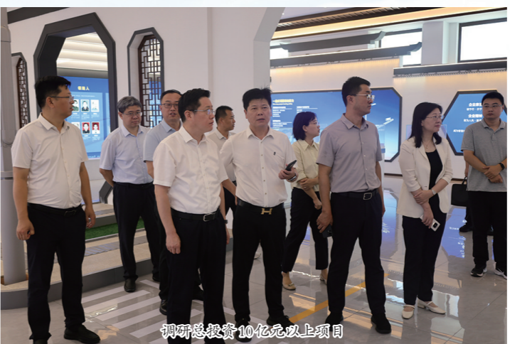
调研总投资10亿元以上项目