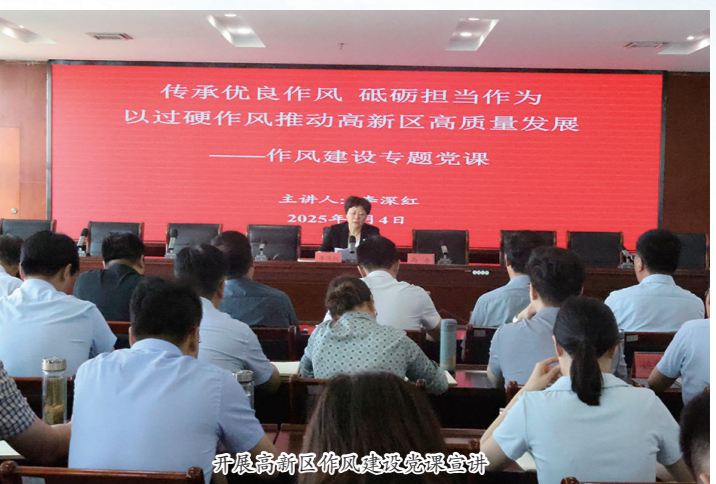
开展高新区作风建设工作部署