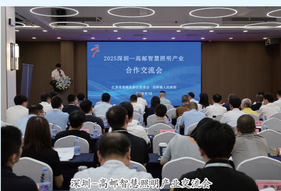
深圳-高邮智慧照明产业交流会

党建工作稳步推进。 紧盯199家“三有”非公企业,通过“党(工)委月度调度、领导包干入企、镇村上下联动”形式,合力攻坚推动,有效提升了非公企业党组织工作;新建镇级站点1个、社区站点4个,覆盖率达100%,目前5个站点均已投入使用,每月组织开展主题活动,已开展活动10余场;积极开展第一期党员基本培训,并启动“三学三比三争”专项活动,通过“现场+线上”模式,累计1000余人参训。