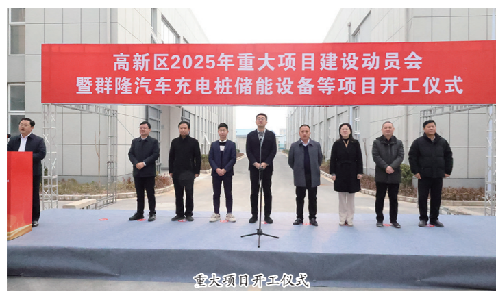
重大项目开工仪式