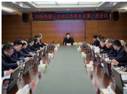
市长郑志明主持召开国土空间工作委员会第一次会议