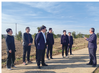
扬州市级副林长张长金、高邮市委书记田醒民开展巡林工作