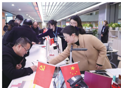
市自然资源和规划局党组书记、局长刘玲体验不动产登记窗口办事流程