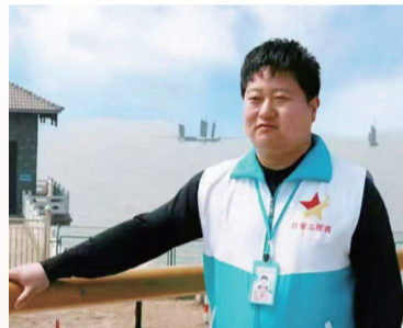
高邮市政协常委、民进高邮小组组长、市新联会会长、市红星志愿者协会荣誉会长 市秦邮老兵志愿者服务中心理事长

十年栉风沐雨,十年春华秋实。高邮市红星志愿者协会将始终与时代同行、与人民同心,继续书写属于这座城市的温暖篇章。我们期待更多爱心人士加入这个充满力量的大家庭,让每一颗红星都闪耀出最璀璨的光芒!