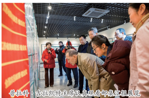
普拉科·吉拉凯特主席认真观看邮集汇报展览