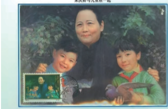
庆祝我与儿童在一起

在我们这颗蓝色星球上，在爱心的关怀中，他们幸福健康快乐地成长。儿童是世界的未来，世界的未来属于今天的儿童。