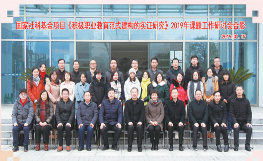
国家社科基金项目《积极职业教育范式建构的实证研究》课题研讨