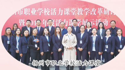
扬州市职业学校活力课堂

2019年,11月初,扬州市职业学校活力课堂教学改革研讨会暨2019年度活力课堂展示活动在高邮中专举行。活动特邀《中国职业技术教育》杂志常务副主编席东梅做《基于教科研的论文选题与写作》讲座。高邮中专16名省市教学大赛获奖教师开设了以“活力课堂”为主题的教学展示课,获一致好评。