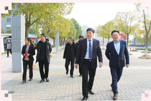
高水平现代化视导专家组视察校园

2019年9月18日至21日,高邮中专牵头江苏传艺股份有限公司、扬州华盟电子有限公司等8家企业赴甘肃陇西、秦安等地,进行校企合作洽谈,两地的赴会人员对此交流交流活动表现了极浓厚的兴趣,共签订意向用工协议752份。