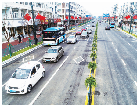
经过几个月施工,海潮东路提升提质工程于国庆节全面实现通车。瞧!宽阔的海潮大道已经成为一道靓丽的风景线。