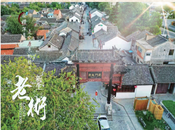
南门大街开街时间:9月28日

将孟城驿、南门大街、运河西堤、高邮湖等片区进行串联,以大景区概念来打造国家5A级旅游景区,孟城驿景区一方面要继续推进东市二期建设,分别进行纯旅游、商业业态、纯商业等开发。另一方面回购南门油厂建设主题客栈,并继续打造南门大街“好事成双、邮城好礼”的商业载体,确保“十一”国庆期间正式开街,同时在运河西堤实施平津堰遗址保护和展示工程建设,自营酒店和餐饮,强化运营及环境的维护管理,并继续策划举办西堤七夕音乐节、大闸蟹节、环湖自行车赛等大型活动,为广大游客提供优质的观光旅游体验,并方便市民休闲游乐。