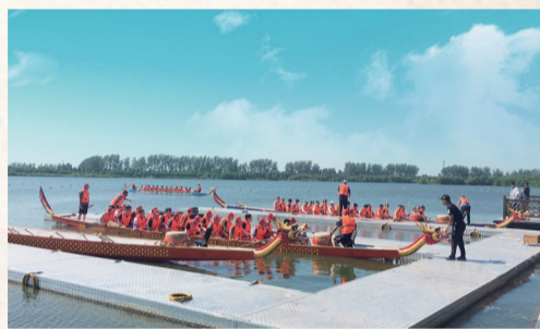
清水潭龙舟赛时间:10月7日

完成旅游步道调整、河道清淤、双花岛建设、野鸭放飞及鸭舍改建等工程,并围绕普照街招商、夜市打造、温泉酒店、餐饮、土特产品销售、文创商品开发等建设持续发力,落实玻璃屋、靶场、陆上闯关探险、儿童拓展等项目,增设自驾车营地、林间木屋、船屋,策划端午龙舟赛、网红打卡和舞台表演活动,提升景区质态,完善景观绿化和亮化,拓展了高邮旅游线路,提升旅游品质。