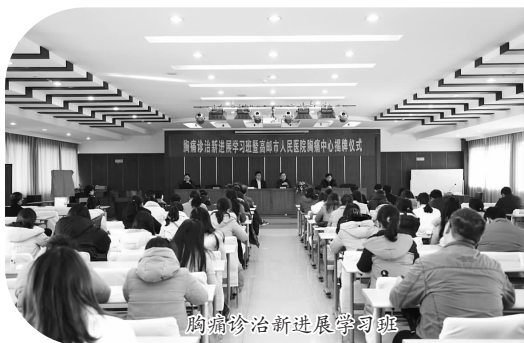
胸痛诊治新进展学习班