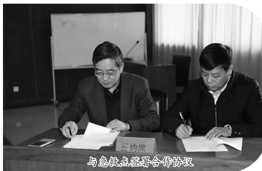
与急救点签署合作协议

12月18日上午,高邮市人民医院胸痛中心揭牌仪式暨扬州市继续教育项目《胸痛诊治新进展》学术讲座在高邮市人民医院六楼大会议室隆重举行。这也是扬州市第二家“胸痛中心”——高邮市人民医院胸痛中心正式成立,开启了我市急性心梗救治新模式。