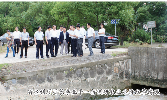
省水利厅厅长李亚平一行调研农业水价改革情况