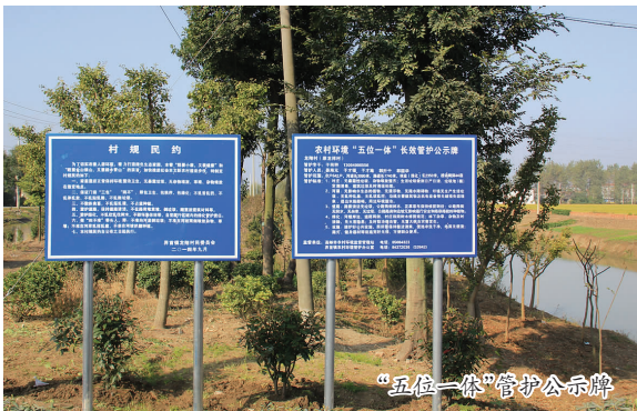
“五位一体”管护公示牌