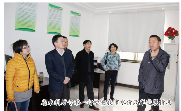
省水利厅专家一行检查我市水价改革进展情况

检、年终综合考核的办法，根据管护实效进行补助，进一步调动全市各方面的力量，确保小型水利工程正常运行。