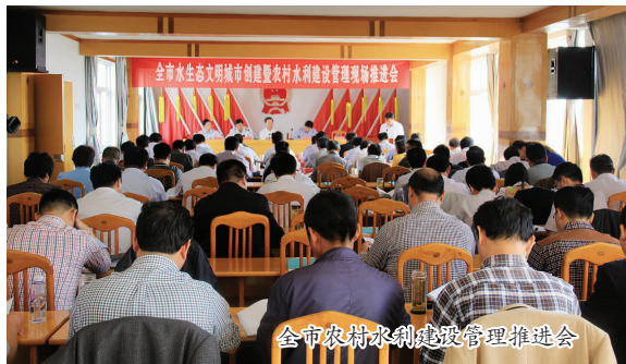
全市农村水利建设管理推进会