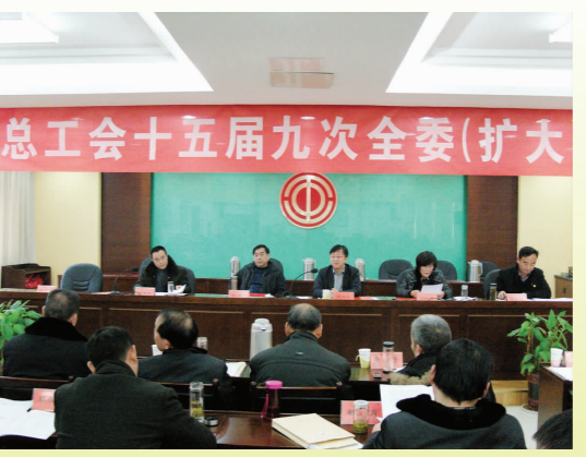
市委常委、组织部部长孙建年出席市总全委会并讲话

和“优秀宣传信息员”。 三、突出和谐共建，强力打造科学依法维权品牌 一是完善工会源头参与机制。主动加强与市人大、政府、政协及有关部门沟通联系，有效发挥工会与政府联席会议制度和协调劳动关系三方会议制度的运行，积极参加涉及职工切身利益的政府部门协调会议，反映职工的意愿、想法和呼声，提出工会的主张和建议，使政府出台的政策措施更体现民意，符合职工承受能力。积极组织好有关决议执行情况的监督检查，维护职工的合法权益。二是完善基层劳动关系协调机制。积极推动实施《劳动合同法》、《劳务派遣用工管理暂行规定》，指导职工签订劳动合同，代表职工签订集体合同和工资协议。大力开展以“共建和谐、共促发展”为主题的劳动关系和谐企业创建活动，努力构建和谐劳动关系，力争全市70%以上已建工会企业符合省劳动关系和谐企业标准。三是完善劳动保护监督工作机制。加快实现“1+3”安全监控体系在规模以上企业的全覆盖，推动工会劳动保护与政府安全监管有序对接。深入开展“安康杯”竞赛活动，建立健全工会劳动保护监督检查组织体系，在高危