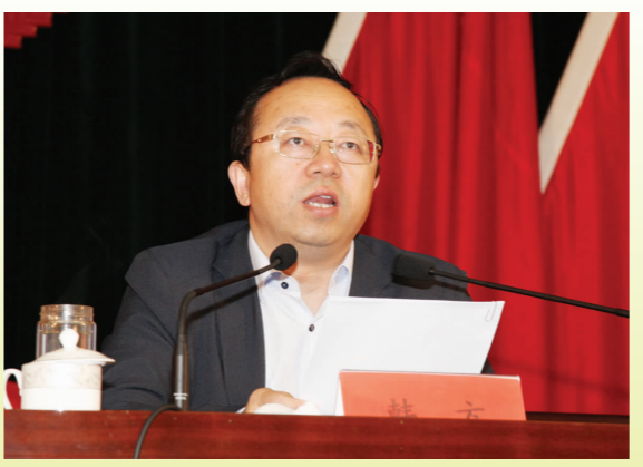
市委书记韩方在全市庆“五一”暨劳模表彰大会作重要讲话