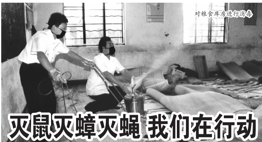
对粮食库房进行消毒