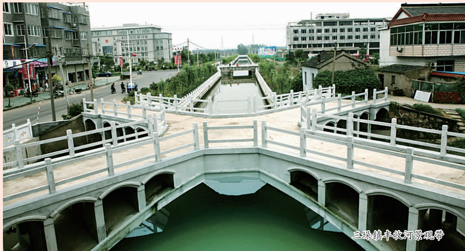
三阳桥中晚灯景观带