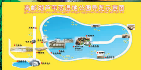
高邮湖界首镇芦苇荡湿地公园