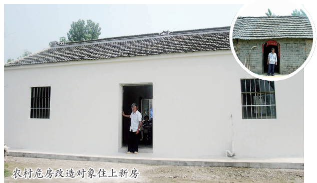
农村危房改造对象住上新房

老龄事业稳步发展。 全市共有居家养老服务中心(站)112个,新增新联、御码、文游3个社区居家养老服务站,开展政府购买居家养老服务工作,全市共8个社区的180名老年人纳入服务范围。全面实施80周岁以上老年人尊老金制度,全市共1.91万名老年人享受到普惠型公共财政的“阳光”,全年发放尊老金330.1万元。全力推进市社会福利中心建设,项目选址