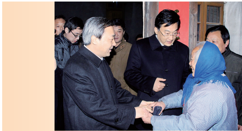
市委书记丁一陪同扬州市市长谢正义看望孤寡老人