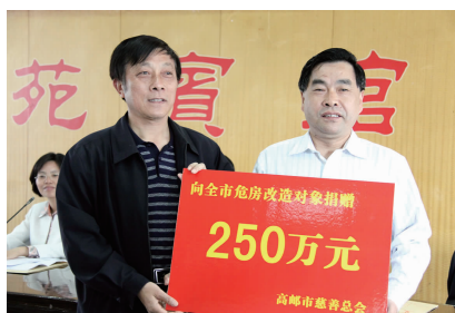
慈善总会向全市危房改造工程捐款