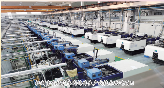
捷豹中高档汽车内饰件生产线技术改造项目