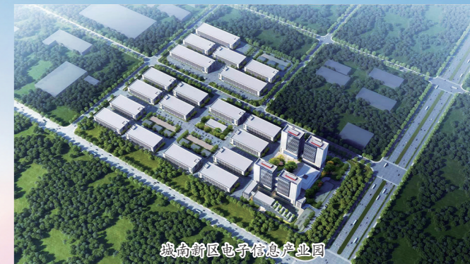
城南新区电子信息产业园