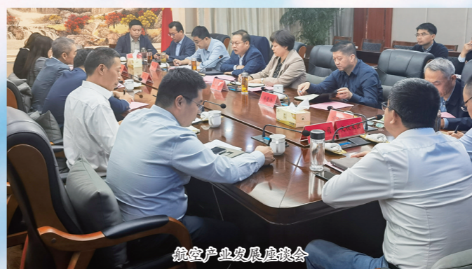
低空产业发展推进会