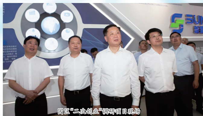
园区“二次创业”调研项目现场