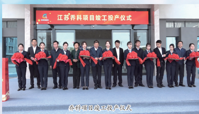
乔科项目竣工投产仪式