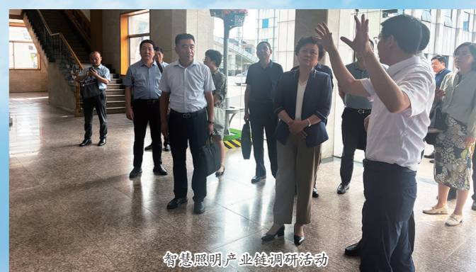
智慧照明产业调研活动

2023年,在市委、市政府的坚强领导下,全市上下以“发力奋进年”为总抓手,始终坚持把重大项目建设作为推动经济发展的“头版头条”,凝心聚力抓项目,全力以赴谋发展,释放项目驱动力,以高质量项目助推经济社会高质量发展,为建设现代化新高邮积蓄磅礴动能。