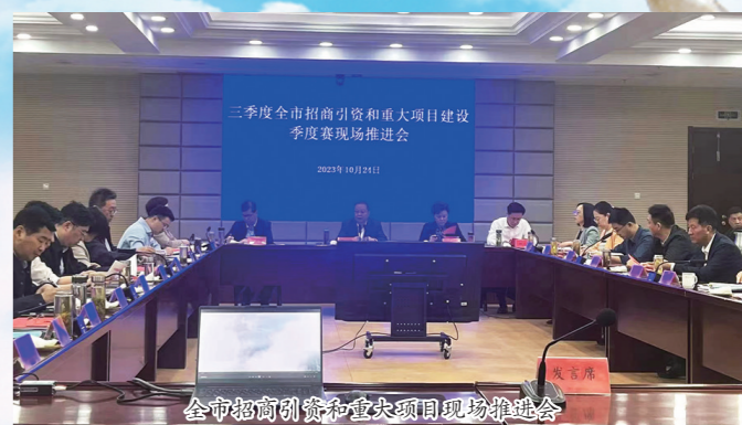
全市招商引资暨重大项目现场推进会