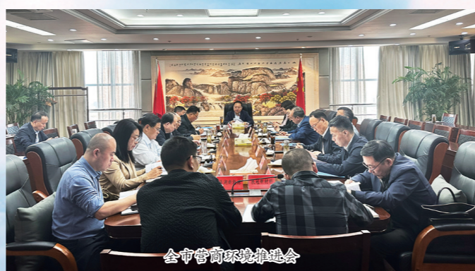
全市营商环境推进会