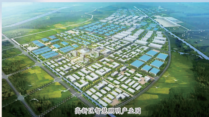
高新区智慧照明产业园