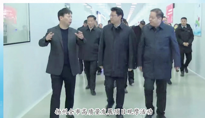
扬州市高质量项目观摩活动