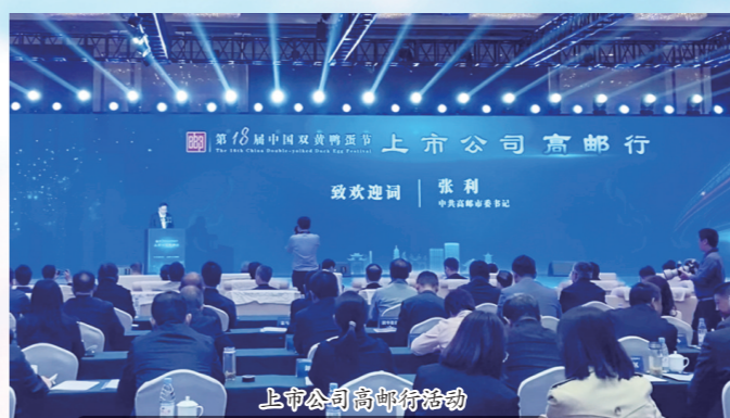
上市公司高邮行活动