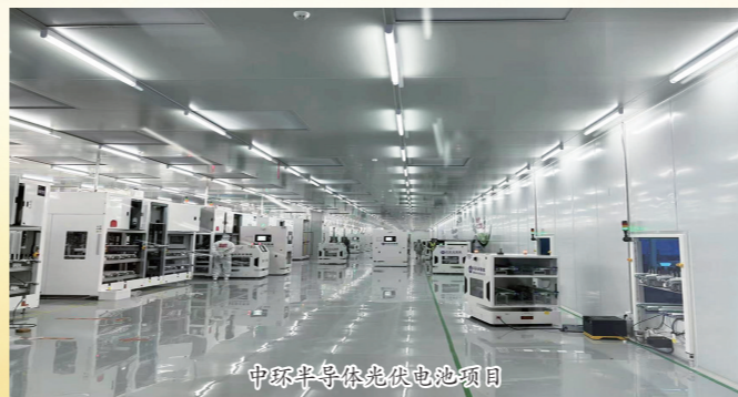
中环半导体储能电池项目