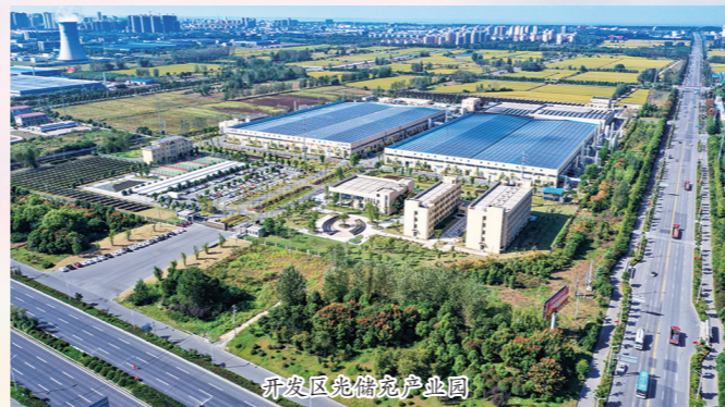
开发区氢能产业园

牵头编制氢能产业中长期发展规划及通用航空产业发展规划,围绕绿氢制备及供应、氢能装备制造、氢能技术创新、氢燃料电池汽车关键零部件及测试认证等,着力打造细分领域特色产业高地;依托高邮通用机场,围绕无人机领域、模拟飞行器训练器械、航空零部件等内容,着力打造“低空经济产业园区”;创新实施市领导挂钩联系优势产业链,各产业链挂联市领导多次带领小分队赴乡镇(园区)、企业开展现场调研活动,帮助企业解决“急难愁盼”问题,助力产业链高质量发展。