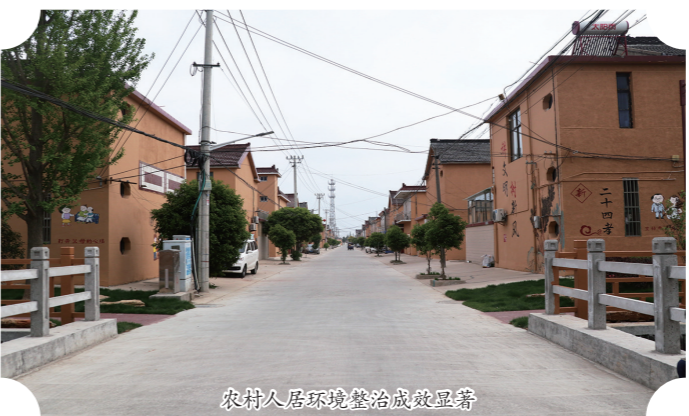
农村人居环境整治成效显著