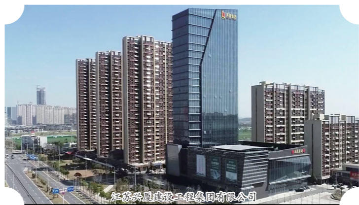
江苏凤凰置业工程集团有限公司