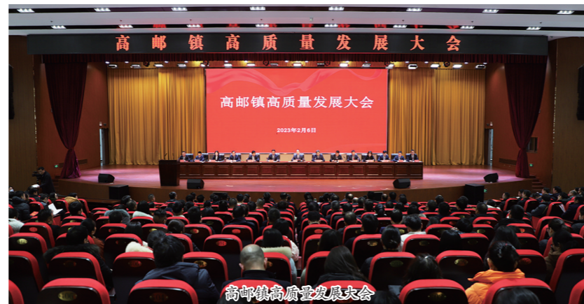
高邮镇高质量发展大会