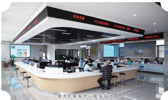
镇为民服务中心服务窗口

要加强党的建设,把准高质量发展“定盘星”。坚定不移推进全面从严治党,以高质量党建引领现代化建设,不断开创高质量发展新格局。强化理论武装,分层分类多形式抓好党员干部教育培训,严格落实意识形态工作责任制。夯实基层基础,加强基层党组织书记队伍和“两委”班子建设,有序开展年轻干部“正心学堂”培训,组织“最聚人气党群服务中心”评选,持续打造党建红色品牌,推进新就业群体服务阵地“4+15+N”体系建设。强化执纪监督,聚焦落实管党治党政治责任;加强作风建设和廉洁教育,持续开展“三项推选”,从严查处党员干部违反中央八项规定精神等问题,围绕中心工作持续开展监督检查,推进政治监督具体化、精准化、常态化。