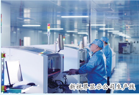
新视界显示公司生产线