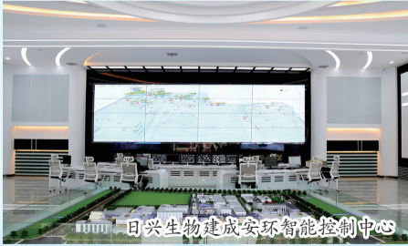
日兴生物建成安环智能控制中心