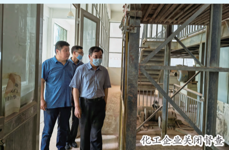
化工企业关闭督查