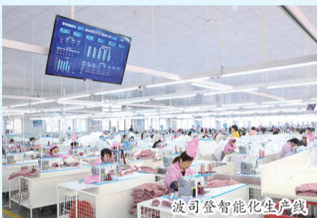
波司登智能化生产线