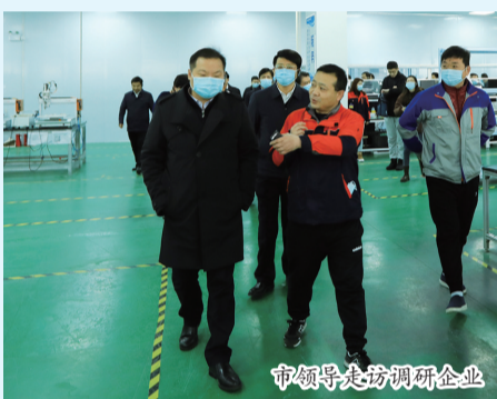
市领导走访调研企业