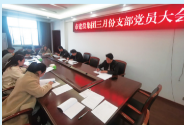
开展党员统一活动日活动