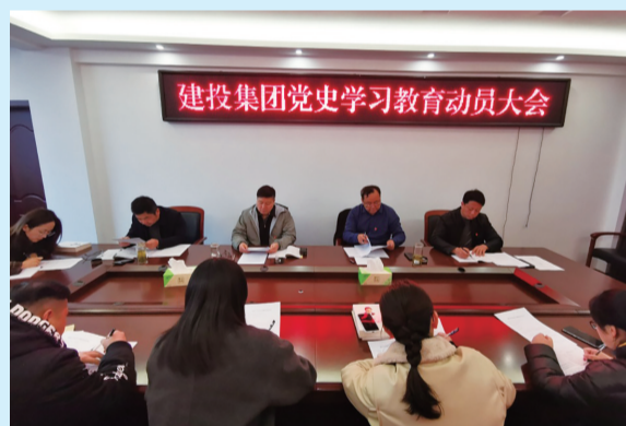
党史学习教育动员大会