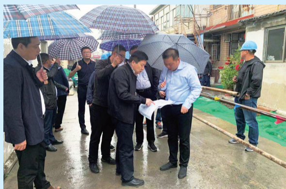
雨污水分流施工现场

面对新形势、新机遇、新挑战,集团将认真按照中央全面深化改革精神,认真落实市委、市政府要求,围绕实体化、可持续发展目标,提高服务发展、服务大局的能力和水平,实现经济效益、社会效益的双赢,为城市高质量发展做出更大的贡献。