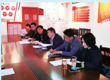
集团主要领导率队深入基层开展走访调研活动