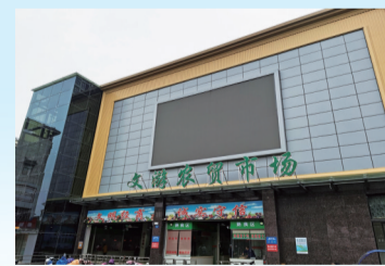
文游农贸市场建设项目