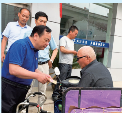
走访慰问贫困家庭