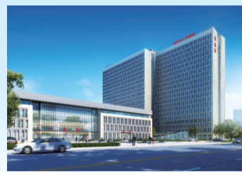
人民医院东区建设项目