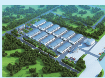
五里坝国家粮食储备库迁建项目