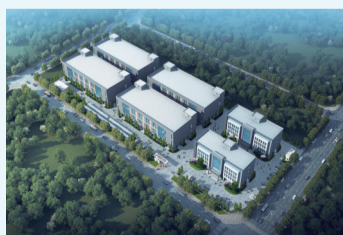
江苏联环医疗器械项目

分别是:汉胜梦人工智能科技项目、超净医疗设备制造项目、通乐电子科技项目、裕富汽车科技项目、一首机械项目、晶富扬智能设备项目、林阳米业项目、京运水产加工项目,并且全部完成了签约注册,实现了全年任务半年完成的目标。