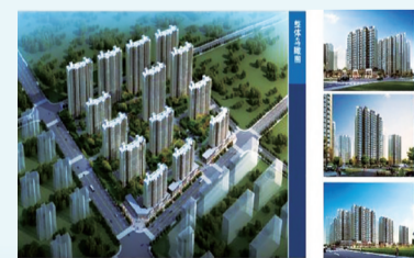
江苏美江建筑劳务项目(总部经济项目)