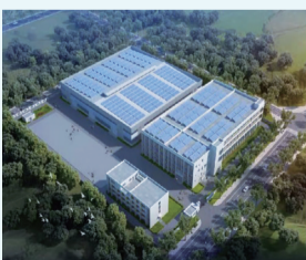
扬州启朔新能源设备项目