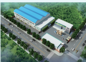
高湖蛋品、农副产品深加工项目