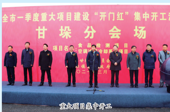
重大项目集中开工

今年以来,甘垛镇在市委市政府的坚强领导下,紧紧围绕“实力甘垛、美丽甘垛、和谐甘垛、幸福甘垛”建设目标,坚持“工业强镇、农业稳镇、项目兴镇、生态立镇”发展路径,全镇上下弘扬比学赶超,聚力团结奋进,矢志振兴崛起,谱写新时代甘垛高质量发展的实干新篇章。