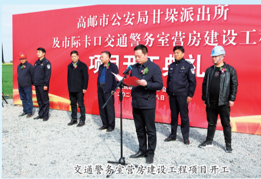
交通警察室营房建设工程项目开工