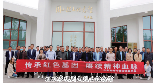
组织参观周山烈士纪念馆