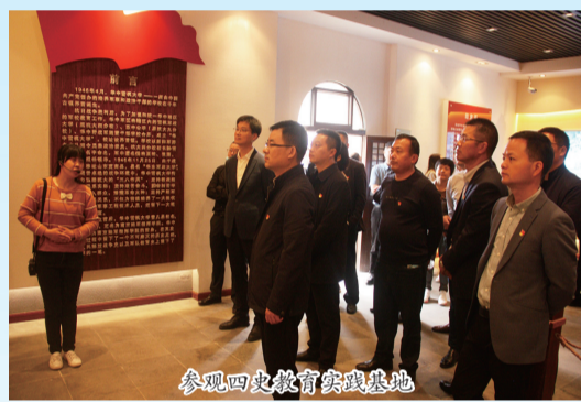
参观四史教育实践基地