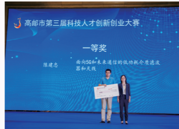
荣获创新创业大赛一二等奖

坚持把创新作为经济动力源,用好用足市技改、区扶持政策“催化剂”和基金池“红杆”,推动北方动力、玄裕电子新上“高大上”设备,加快亿泰、澳洋顺昌等技术改进步伐。同时,深化政产学研对接合作,打出高位嫁接、借力借智“组合拳”,推动重庆大学科研成果为高袁机械赋能,中康环保、高强、健龙蜗牛养殖等公司引入技术“智囊”。上半年,江苏省科技型中小企业入库33家,综合体、孵化器新增入驻企业31家,专利授权326件,发明专利授权30件。