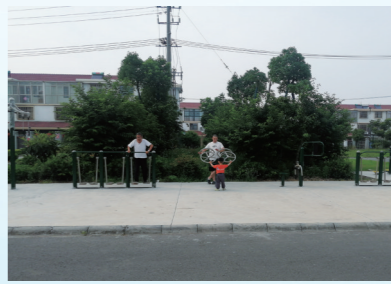
飞达小区新建健身广场