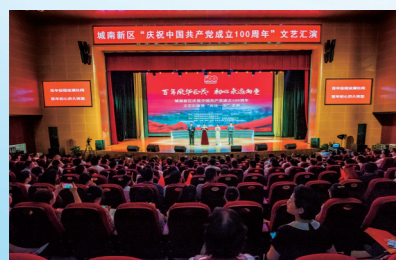
庆祝中国共产党成立100周年文艺汇演