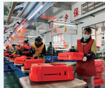
金智达上半年开票达2亿元