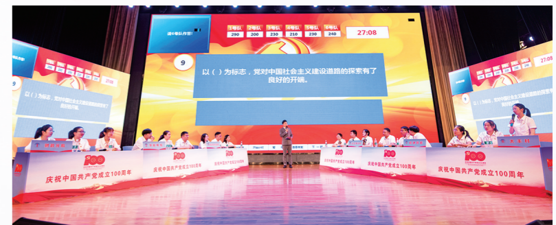
荣获市党史知识竞赛第一名

坚持学与思结合、学与行同步,做优“比赛榜单”,举办党史征文、党史知识、党史党纪对碰系列比赛,以比促学、以赛促优,荣获市党史知识竞赛第一名。做精“特色菜单”,开展老党员寻访、支部联建、教育实景课堂、“小板凳”移动讲堂等特色活动,推动党史学习教育走进家庭企业、田间地头。做实“项目清单”,列出货真价实民生项目“任务书”“时间表”,一茬茬压实、一件件推进,完成了积水内涝、低压供水等一批难事,道路硬化、健身广场等一批实事,梦想小屋、慈善募捐等一批好事。