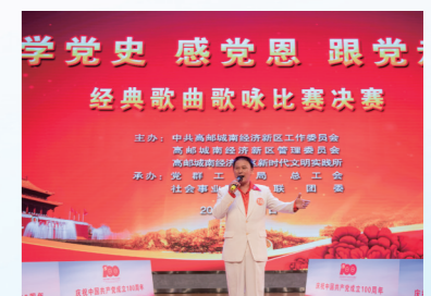
学党史 感党恩 跟党走 歌咏比赛