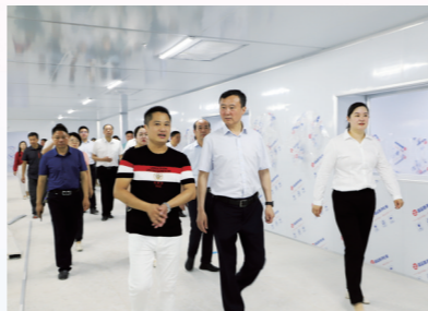
区二季度重大项目观摩

坚持把创新作为经济动力源,用好用足市技改、区扶持政策“催化剂”和基金池“红杆”,推动北方动力、玄裕电子新上“高大上”设备,加快亿泰、澳洋顺昌等技术改进步伐。同时,深化政产学研对接合作,打出高位嫁接、借力借智“组合拳”,推动重庆大学科研成果为高袁机械赋能,中康环保、高强、健龙蜗牛养殖等公司引入技术“智囊”。上半年,江苏省科技型中小企业入库33家,综合体、孵化器新增入驻企业31家,专利授权326件,发明专利授权30件。