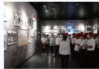
基层党组织开展党史实景学习