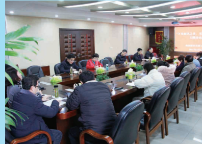
“不负新区之名 无愧责任担当”主题活动拉开序幕