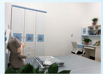
梦想小屋为爱启航