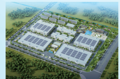
总投资50亿智纬项目鸟瞰图