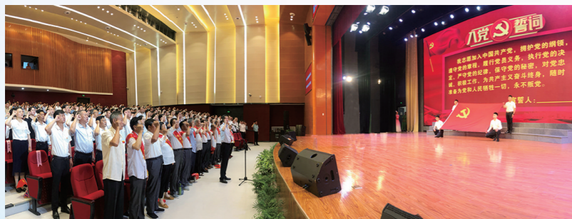
全体党员宣誓、重温入党誓词

坚持“不负新区之名 无愧责任担当”主旋律,深入开展争先创优“三个思考”、新区发展“三个为什么”、主动作为“三种状态”大讨论,激发了全区上下敢与强的比、同快的赛、向高的攀的拼抢意识,一班人齐心协力在“普遍在做”的方面做得更好更快,在“没有先例”的方面力争做出成功案例,在解决“共性问题”上积累先行经验。上半年,成功到账第一笔零成本产业外资,获评扬州市首个县级服务外包示范园区,取得了供应链金融等要素保障方面的有效突破,建筑业大比武激发了建筑业企业“比学赶超”的干事劲头,总部经济集聚效应、外溢效应明显提高。