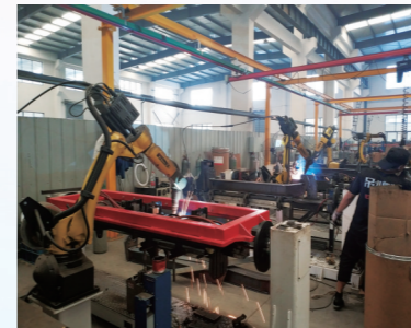
北方动力新上焊接机器人