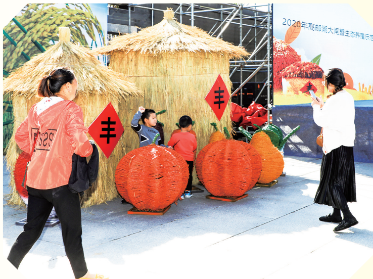
今年国庆、中秋双节期间,高邮旅游市场红红火火,各类活动精彩纷呈,老百姓脸上洋溢着幸福的笑容,高邮上下呈现一派欢乐祥和的美好氛围。