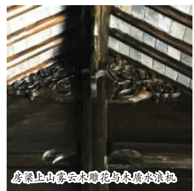
房梁上山雾云木雕花与木质水浪机