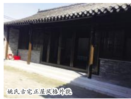
姚氏古宅正屋风格外貌