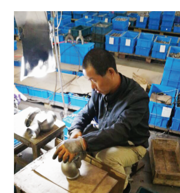
▲就业帮扶让贫困家庭成员实现就业