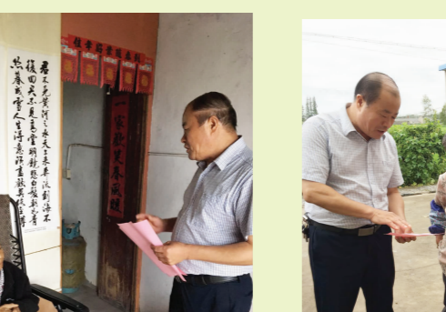
▲乡镇劳保所同志为最贫困家庭人员送上人社帮扶大礼包