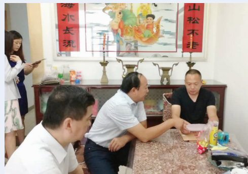
▲市人社局、人保财险公司负责人上门为最贫困家庭送上商业保险赔付金