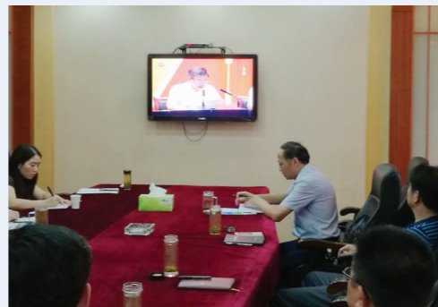
▲市人社局集中组织观看市委召开的帮扶最贫困家庭相关会议