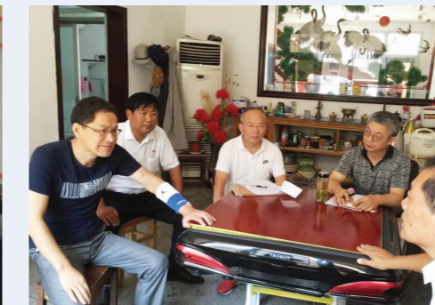
▲市人社局就业失业负责人逐户到有就业需求的最贫困家庭开展就业帮扶