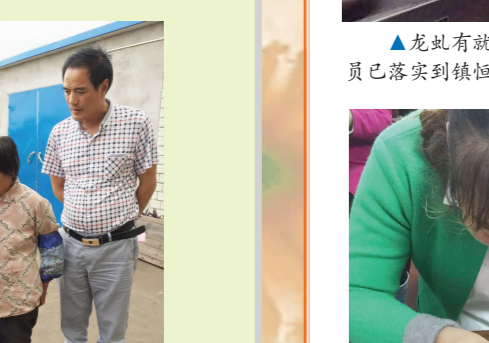
▲乡镇劳保所同志为最贫困家庭人员送上人社帮扶大礼包