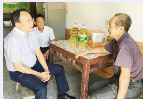
▲市人社局主要负责人走访最贫困家庭