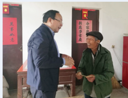
▲市人社局主要负责人走访最贫困家庭