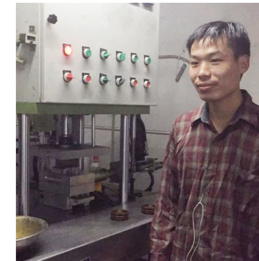
▲龙虬镇有就业需求的贫困家庭成员已落实到镇恒顺机械公司上班