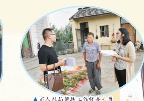
▲市人社局帮扶工作督查专员走访贫困家庭,现场解决困难