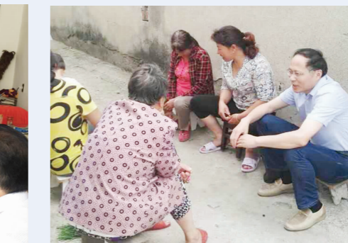
▲市人社局负责人与最贫困家庭面对面谈心