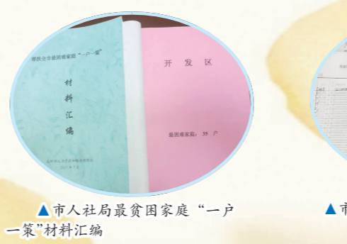
▲市人社局最贫困家庭“一户一策”材料汇编