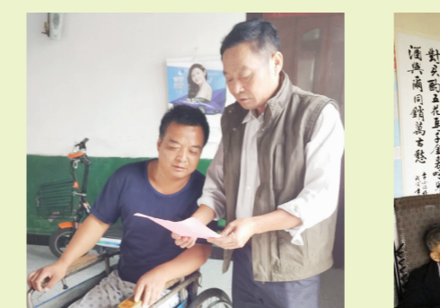
▲乡镇劳保所同志为最贫困家庭人员送上人社帮扶大礼包