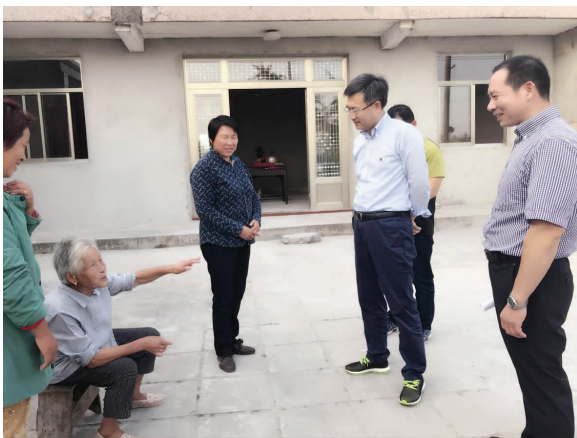
10月9日下午,市委书记勾凤诚来临泽镇走访8户最贫困家庭,深入了解他们的家庭状况以及帮扶措施落实情况。李明艳