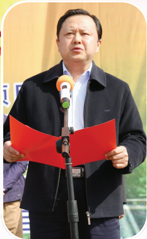
市委常委、政法委书记徐健讲话