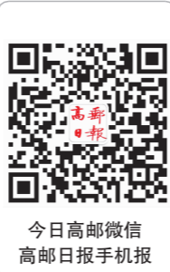
今日高邮微信 高邮日报手机报