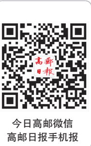
今日高邮微信 高邮日报手机报