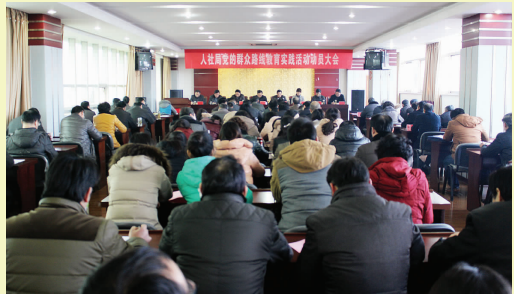
人社局召开全系统教育实践活动动员大会