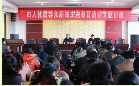
人社局邀请市委党校教师宣讲群众路线