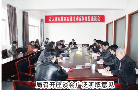
局召开座谈会广泛听取意见

行政服务中心人社窗口主要承担我局八项行政审批事项:1. 工伤认定,2. 工伤职工劳动能力鉴定,3. 职工非因工伤残或因病丧失劳动能力鉴定,4. 劳动合同鉴证,5. 企业集体合同审查,6. 职业介绍机构资格认定,7. 职业资格证书核发,8. 特殊工时制度审批。