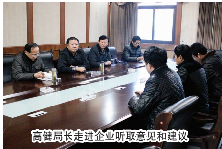
高健局长走进企业听取意见和建议