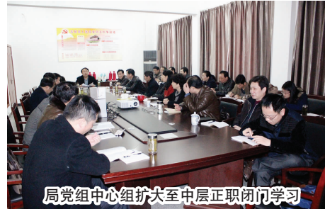
局党组中心组扩大至中层正职闭门学习