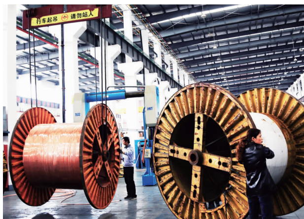
今年,扬州曙光电缆有限公司在逆势中寻找机遇,外拓市场,前三季度实现开票销售近10亿元。目前,该公司正开足马力冲刺全年目标。图为电缆生产线员工正在忙碌的场景。

金春林表示,此次扬州市对我市双拥工作进行检查,对于推动、促进、提升我市双拥工作科学化水平具有重要意义。我市将进一步认真吸收、落实检查组的意见和建议,对照考核标准,进行再宣传、再发动、再督查,狠抓薄弱环节,加大推进力度。(下转二版)