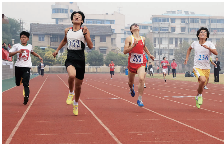
20 日至 21 日,2012 年高邮市中小学生田径运动会在市体育场举行。来自全市各中小学校的 58 个代表队参加了比赛。

张秋红希望临泽镇党委、政府要在全力支持广电中心建设的同时,以广电大楼建设为新的起点,突破传统思维模式,抢抓发展机遇,加快小城镇建设步伐,打造一批精品工程,展示集镇新形象。 周雷森