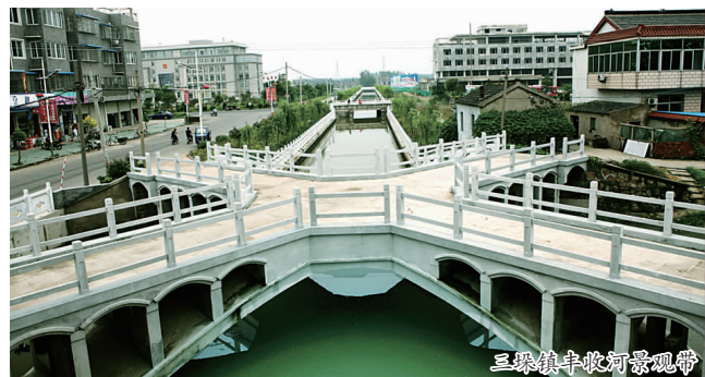
三垛镇丰收河景观带